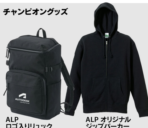
ALP ロゴ入りリュック